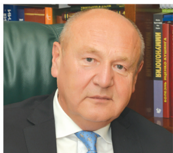
Вице-президент Конгресса академик Геннадий Тихонович Сухих (Москва)