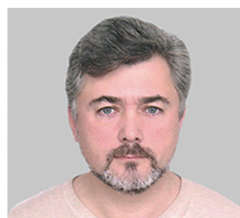
Член-корр. РАН Алексей Николаевич Томилин (Санкт-Петербург)